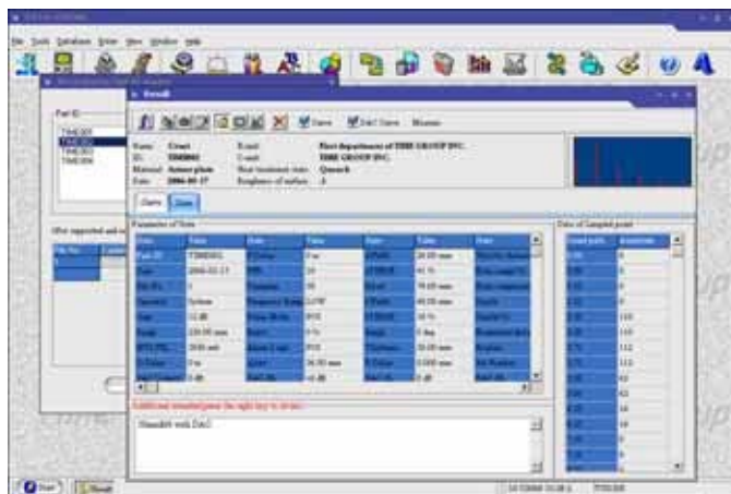
Granskning av data för provningsrapport